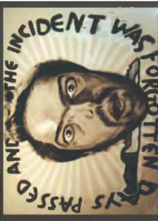
Έργο του Δ. Ανδρεάδη

Στο Πεδίο Δράσης Κόδρα στη Θεσσαλονίκη για έκτη συνεχή χρονιά